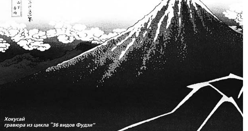
Хокусай гравюра из цикла "36 видов Фудзи"

Уезжаю от Фудзи растерянный и усталый. Все силы любовь отняла.