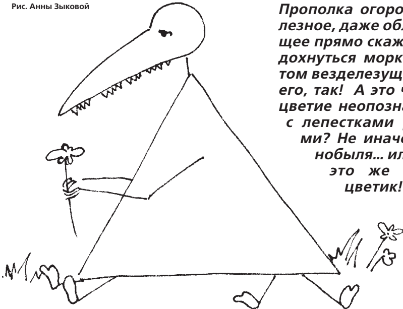
Рис. Анны Зыковой

Прополка огорода - дело полезное, даже облагораживающее прямо скажем. Не дай задохнуться морковке под гнетом везделезущего пырея. Так его, так! А это что еще за соцветие неопознанное, да еще с лепестками разноцветными? Не иначе жертва Чернобыля... или... Постой-ка, это же цветик-семицветик!