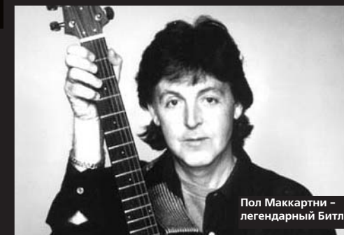
Пол Маккартни - легендарный Битл

Родился Пол Маккартни, участник группы Битлз, автор "Yesterday". Из битлов всего двое сейчас живы - он да Ринго Старр. 24 мая состоится историческое событие - Пол дает концерт в Москве, прямо на Красной площади. Когда-то он пообещал, что ноги его не будет в СССР - обиделся на советскую грамзапись, издавшую его альбом "Back in USSR" без высочайшего разрешения. Но вот СССР больше нет, а Пол жив-здоров и едет наконец к нам.