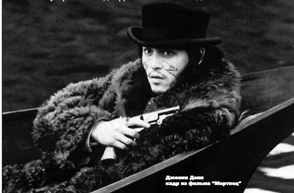
Джонни Депп кадр из фильма "Мертвец"

Родился Джонни Депп (Johnny Depp), американский актер и режиссер. Он сыграл главную роль в фильме Джима Джармуша "Мертвец" (Dead Man). Это один из самых улетных фильмов о смерти, известных редакции ПИ. Также Джонни Депп снимался в фильмах "Аризонская мечта" (Arizona Dreaming), "Страх и ненависть в Лас-Вегасе" (Fear and Loathing in Las Vegas), Сонная Лощина (Sleepy Hollow) и многих других.