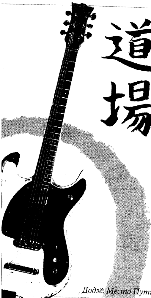
Додзё: Место Пути

"Не смущайтесь, если вы не музыкант. Вы желанный участник, если у вас есть намерение творить звуки".