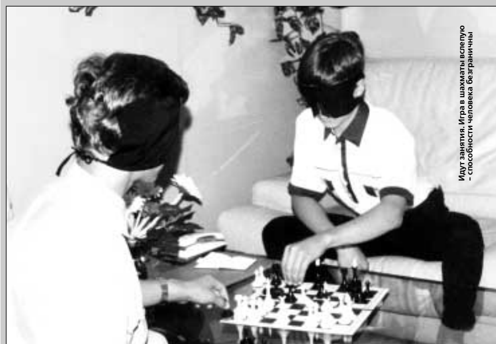
Идут занятия. Игра в шахматы является способностью человека безгранична