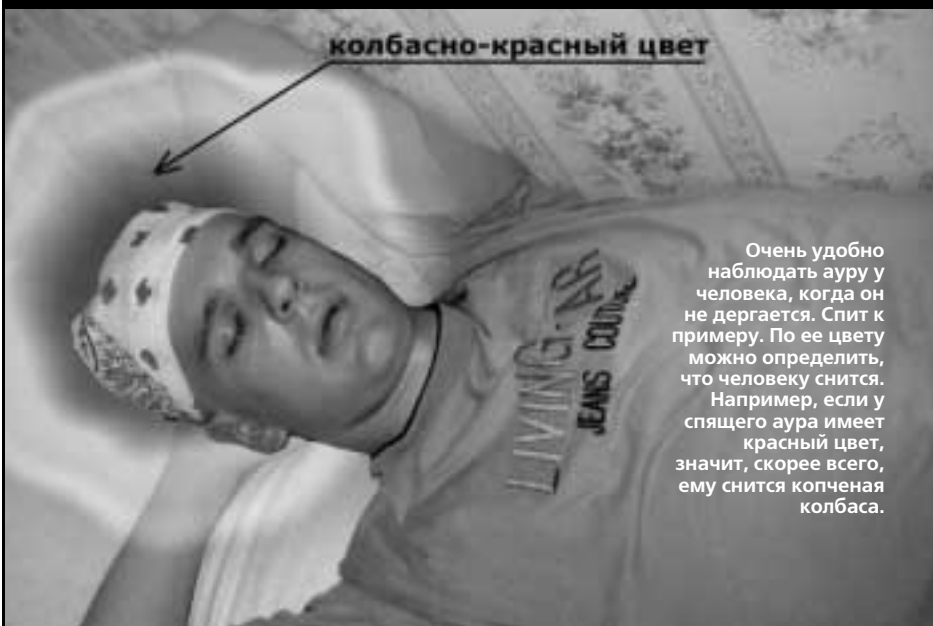
Очень удобно наблюдать ауру у человека, когда он не дергается. Спит к примеру. По ее цвету можно определить, что человеку снится. Например, если у спящего аура имеет красный цвет, значит, скорее всего, ему снится копченая колбаса.

Энергии, которые излучает человек, не только показатель его жизненной активности, но и защитное поле. У человека раздробленного в ауру просматриваются дыры, через которые возможен вход болезням. Человек уравновешенный и спокойный хорошо защищен от болезней и других вредных влияний.