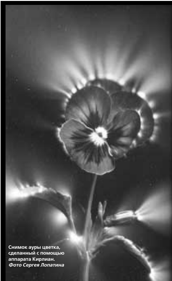
Снимок ауры цветка, сделанный с помощью аппарата Кирлиан.