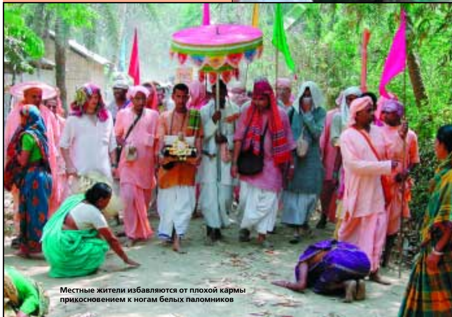
Местные жители избавляются от плохой кармы прикосновением к ногам белых паломников