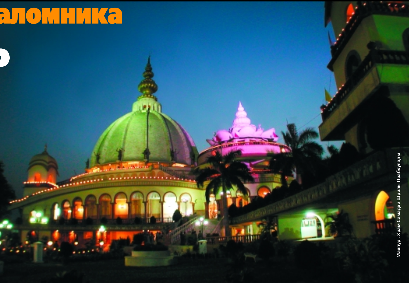
Маяпур - Храм Самадхи Шрилы Прабхупады

Анатолий Тодоров, фотографии автора (продолжение следует)