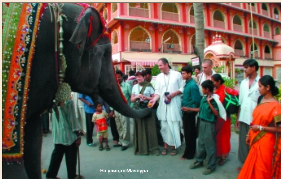
На улицах Маяпура