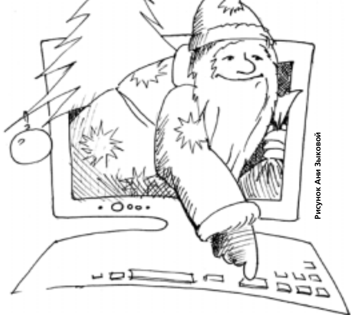
Рисунок Ани Зыковой

Все готовятся к Новому году - подарки, поздравления, праздничное меню. А где всё самое актуальное, свежее и интересное? Конечно, конечно в Интернет! У нас здесь подготовка к Новому году идет уже полным ходом! Заходи и ты узнаешь - как написать письмо самому Деду Морозу, сделать праздничное украшение из соленого теста и что же такое "Новогодняя смесь"!