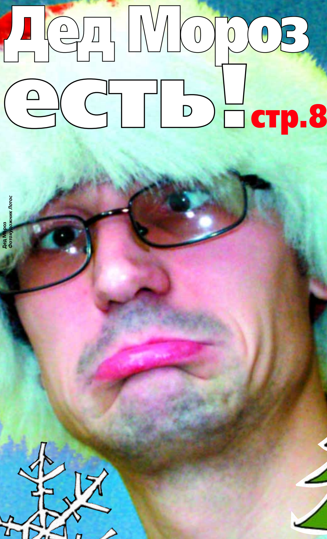
Дед Мороз

В ближайшее время в продаже должны появиться футболки, подпитывающие организм витамином С. Специалисты компании Fuji Spinning Company разработали волокно, содержащее химическое вещество, называемое провитамином, которое при контакте с кожей человека трансформируется в витамин С. Таким образом футболка, сшитая из ткани на основе этого волокна, по содержанию витамина С будет эквивалента двум лимонам. Причем полезный эффект будет сохраняться даже после 30 стирок.