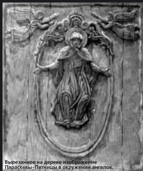
Вырезанное на дереве изображение Параскевы-Пятницы в окружении ангелов.

Параскева Пятница - заступница женщин. Имеет облик красивой девушки или молодой высокой худощавой женщины со светлыми, "лыняными" волосами. Таких женщин в некоторых областях России до сих пор называют "долговязая пятница". Она покровительствует браку и родам, потому часто в народных легендах предстает в виде повитухи. Ведает женской зимней работой, особенно всем, что связано с шитьем и вязанием. Пятницу же молят об удаче в делах, хорошей торговле. Места поклонения Пятнице связаны с водой, с местами, где были "явлены" ее иконы. Храмы ставят рядом с водоемом, или же обязательно роют колодец либо пруд. Целебным считается омовение водой из пятничных источников. Деньги, женские украшения, предметы одежды, а особенно пряжа, кудель или вычесанная овечья шерсть - вот что бросают в эти источники, в дар Пятнице. А еще считается, что Параскева-Пятница превращает в лягушек тех женщин, которые недостаточно ее почитают. Оттого и лягушки на земле пошли.