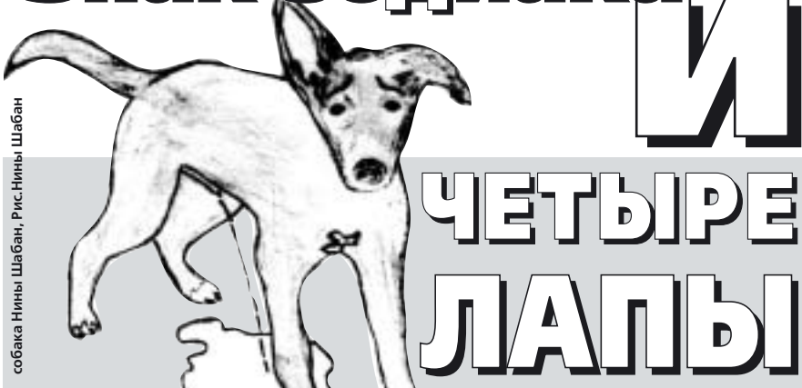
собака Нины Шабан, Рис. Нины Шабан