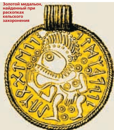
Золотой медальон, найденный при раскопках кельтского захоронения

только после образования Советского Союза были выведены из обращения. Свастика обозначает круговорот бытия, годовой цикл, вечное движение мира. В Вавилоне и Египте свастика была символом солнца и в религиозных представлениях древних, как солярный символ, была тесно связана с такими понятиями, как жизнь, плодородие, удача. В индуизме свастика является воплощением вечной сменяемости жизни, перерождения, "круговорота сансары", движения от микрокосмоса к макрокосмосу. Более того, левая и правая свастики соответственно воплощают богиню Кали-Майю (Луна) и бога Ганеши (Солнце).