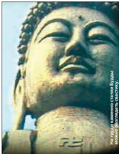
На груди каменной статуи Будды можно разглядеть свастику

Свастикой обозначались энергетические центры человека - чакры. Существует священный рисунок Стопы Будды, который используется как карта для массажа - свасти-