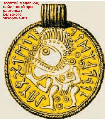
Золотой медальон, найденный при раскопках кельтского захоронения

По материалам археологических раскопок самой богатой территории по применению свастики как религиозного и культурно-бытового символа является Россия - ни Европа, ни Индия не могут сравниться с Россией в изобилии свастик, покрывающих оружие, стяги, национальный костюм, дома, предметы повседневного быта и храмы. Свастика являлась главным и почти единственным элементом праславянских орнаментов. Рас-