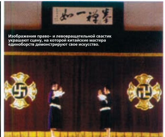
Изображения право- и левовращательной свастики украшают сцену, на которой китайские мастера единоборств демонстрируют свое искусство.