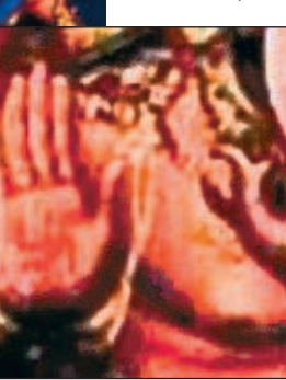
Иллюстрация к статье "Свастика"

В китайском буддизме свастика называется "мандзи" и считается символом совершенства и олицетворением Закона Будды, которому подвластно всё сущее. Вертикальная черта указывает на взаимосвязь Неба и Земли, горизонтальная - на борьбу извечных противоположностей Инь и Ян. Поперечные штрихи, направленные влево, олицетворяют мягкость, сострадание, добро, вправо - твердость, постоянство, разум и силу. Мандзи является эмблемой монастыря Шаолинь, равно как и иных центров единоборств. Многие приверженцы восточных боевых искусств носят на своих кимоно именно символ мандзи, символизирую-