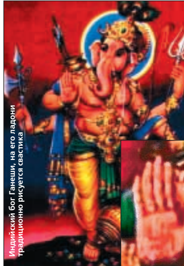
Индийский бог Ганеши, на его ладони традиционно рисуется свастика

Вещий Олег прибил на ворота Царьграда (Константинополя) свой щит, украшенный изображением свастики. Стены загородной резиденции Петра I были расписаны свастиками. Потолок тронного зала в Зимнем Дворце покрыт этими священными символами и сегодня. По специальному заказу и эскизам Николая II даже были изготовлены матрицы для печатания российских ассигнаций с изображением свастики ("коловрата") на фоне двуглавого орла. После свержения самодержавия свастика появилась на новых денежных купюрах Временного правительства, а после октября 1917 года - на дензнаках большевиков. В Советской России с 1918 г. свастика с аббревиатурой РСФСР внутри украшала нарукавные нашивки бойцов Красной Армии. Начиная с 1918 года, большевиками были введены в обращение новые купюры достоинством 1000, 5000 и 10000 рублей, на которых изображена свастика. Деньги со свастикой были в обиходе вплоть до 1922 года, и