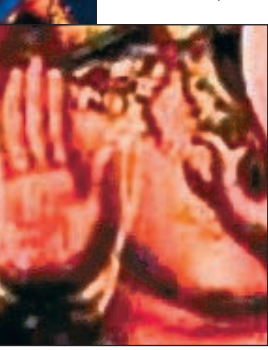
Индийский бог Ганеши, на его ладони традиционно рисуется свастика

В китайском буддизме свастика называется "мандзи" и считается символом совершенства и олицетворением Закона Будды, которому подвластно всё сущее. Вертикальная черта указывает на взаимосвязь Неба и Земли, горизонтальная - на борьбу извечных противоположностей Инь и Ян. Поперечные штрихи, направленные влево, олицетворяют мягкость, сострадание, добро, вправо - твердость, постоянство, разум и силу. Мандзи является эмблемой монастыря Шаолинь, равно как и иных центров единоборств. Многие приверженцы восточных боевых искусств носят на своих кимоно именно символ мандзи, символизирую-