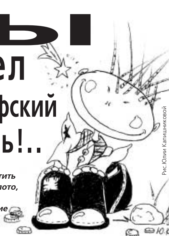
Рис. Юлия Капишниковой

ОН способен превратить любой предмет в золото, ОН дарует своему владельцу бессмертие