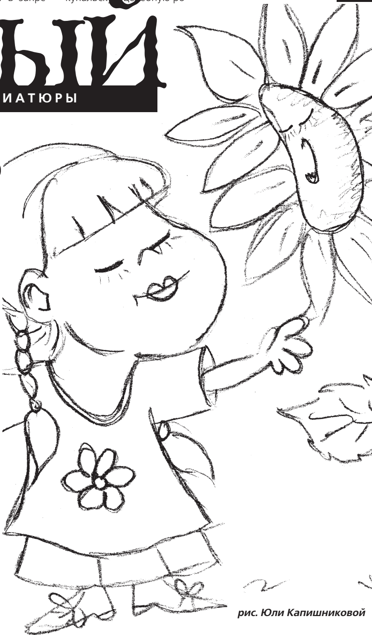
рис. Юли Капишниковой

Рыба приветливо махнет тебе плавничком в ответ на букетик незабудок, фиалок или весенних крокусов. А вот водоросли вопреки здравому смыслу дарить рыбе не стоит, хотя они и считаются талисманом этого знака. Разве что преподнесите ей их в аквариуме, то-то она удивится.