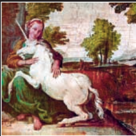
Так примерно девушки приручают единорогов

В отличие от раскожего мнения, единорог не является просто конем с рогом во лбу. В действительности, единорог представляет собой существо с головой, телом и гривой лошади, хвостом геральдического льва, ногами и копытами лани, витым рогом и обязательной борошкой под нижней челюстью. Именно таким он изображен на картинах старинных мастеров.