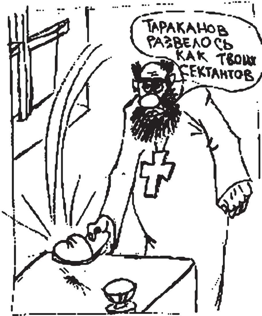
рис. Д. Шарко

Для этого не нужно иметь ни особого ума, ни образования, ни специального мистического чувства, хотя, конечно, все это иметь желательно. Самое главное - обладать непоколебимой уверенностью в себе и жгучим желанием приобщить человечество к истинной истине.