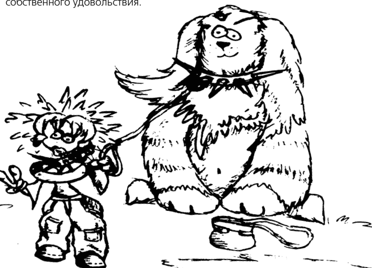
рис. Юли Капишниковой

Конечно же, Рыбам просто необходимы аквариумные рыбки. Кроме того, созерцание их неторопливой жизни очень успокаивает. Если же ухаживать за ними слишком напрягает, нужно постоянно помнить, что тебя звезды причислили именно к этим существам, и поэтому к ним надо быть снисходительнее.