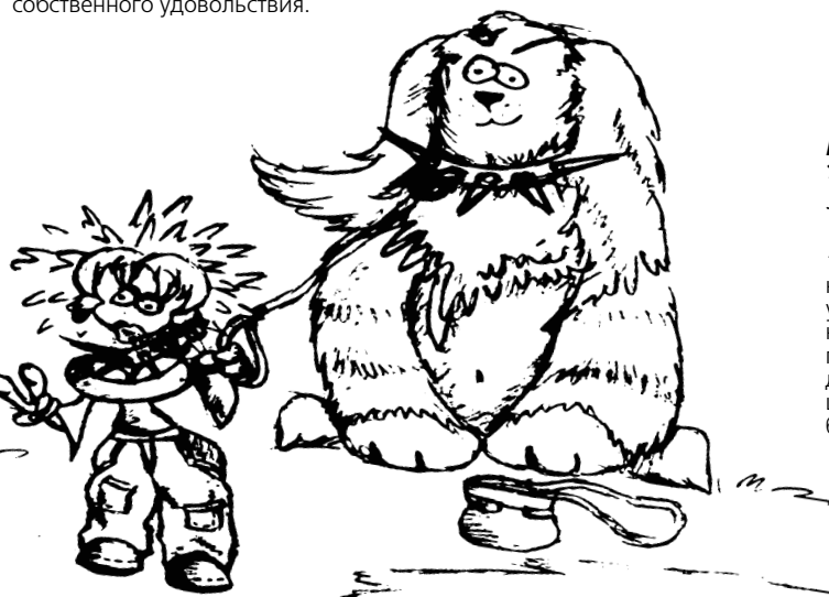
рис. Юли Капишниковой

Символ Весов - ящерица. Впрочем, это относится и к остальным рептилиям. Можно приобрести террариум с ящерицей. Можно даже завести маленького крокодильчика и держать его дома в ванной. Всякие там хомячки и морские свинки отдыхают.