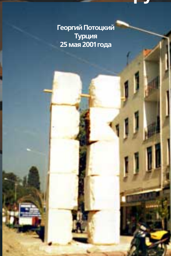
Георгий Потоцкий, автор памятника:

Георгий Потоцкий Турция 25 мая 2001 года