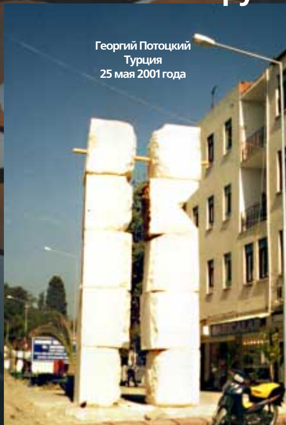
Георгий Потоцкий, автор памятника:

Георгий Потоцкий Турция 25 мая 2001 года